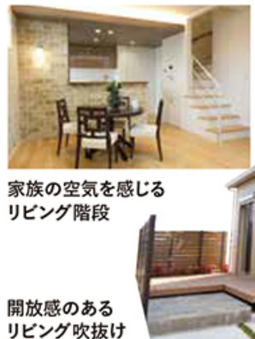
家族の空気を感じる リビング階段