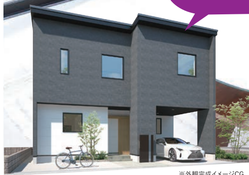
※外観完成イメージCG

ピロティガレージ/2Fリビング/バルコニー ●土地面積/117.60㎡(35.57坪) ●建物面積/106.61㎡(32.24坪) ○建築確認番号/HK21-22106号(R4.4.1) ※このモデルハウスは現在販売していません