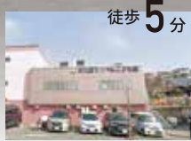
大久保てっぺんこども園

■所在/兵庫県明石市大久保町西脇 ■交通/JR山陽本線「大久保駅」より徒歩約20分(約1600m) ■学校区/山手小学校(約1100m)、大久保北中学校(約1600m) ■団地設備/電気、都市ガス、公営水道、排水(汚水・雑排水は公共下水道へ、雨水は側溝に放流) ■道路幅員/約3.8~6m舗装道路 ■区域区分/市街化区域 ■用途地域/第1種中高層住居専用地域 ■高度地区/第2種高度地区 ■建ぺい率/60% ■容積率/200% ■予定地目/宅地 ■私道負担/有(位置指定道路持ち分) ■団地総区画/2区画 ■建築条付土地販売 ■今回販売区画数/2区画 ■土地面積/107.73㎡・123.78㎡ ■土地販売価格/1865万円・1987万円 ■その他/建築基準法第22条区域<売主>