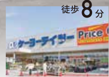
ケ-ヨーティツホームセンター