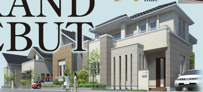
※新築マイエッジ邸