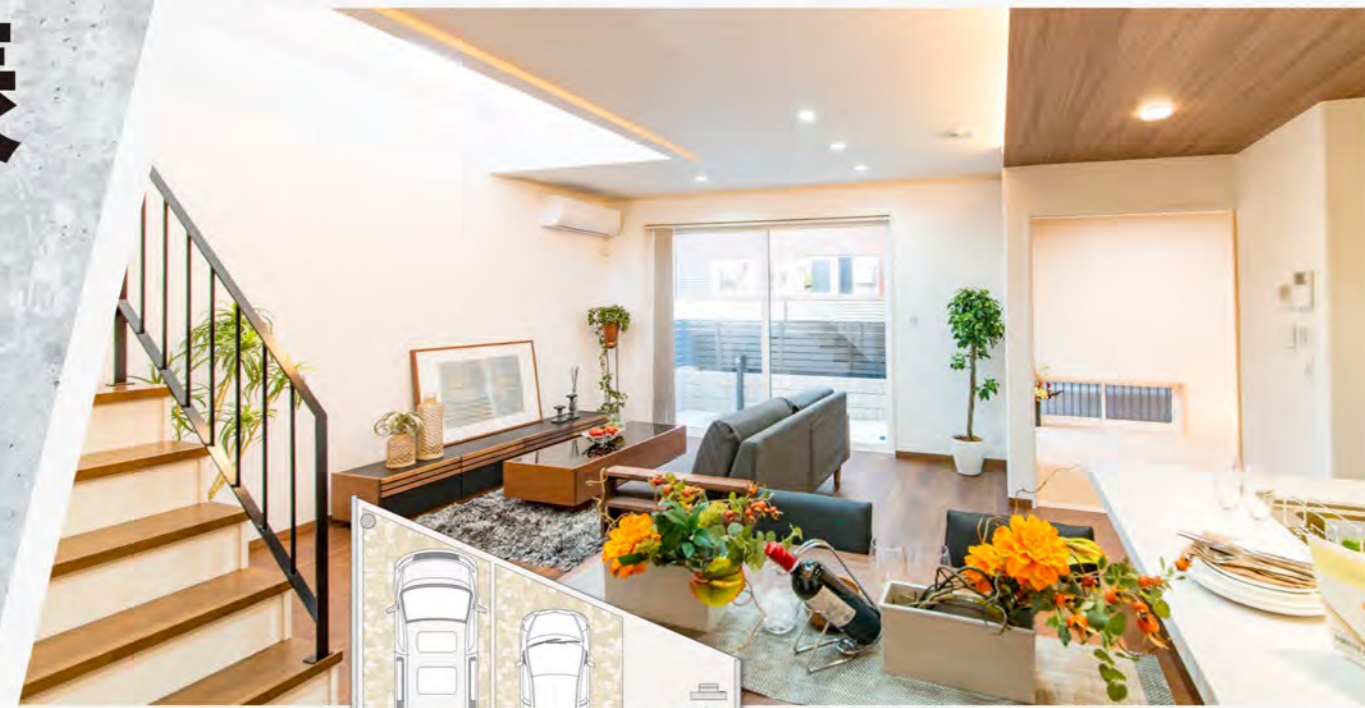
※内観写真は当社施工例