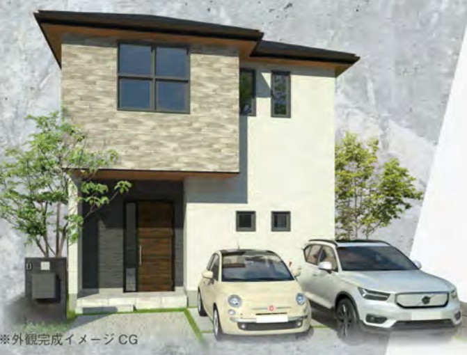
※外観完成イメージCG