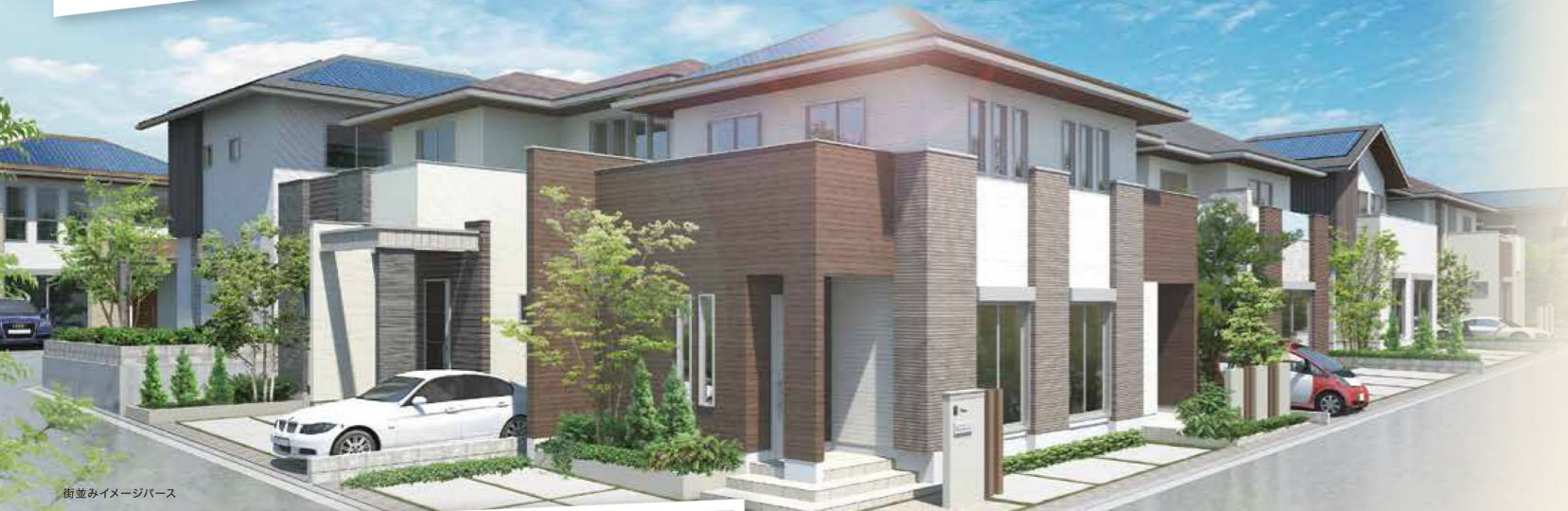
街並みイメージバス

「自由」を分譲地コンセプトにしたビッグスケールの新しい街「Freedom Town西明石藤江VI」が誕生。 駅近の利便性と自然の潤いが身近なロケーションに、55の家族それぞれの自由な暮らしが開花します。